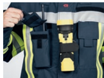
Funkgerätes tasche und Lampenhalterung (optional)