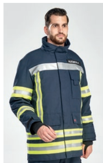
Schutzjacke mit „HuPF“-ähnlicher Bestreifung