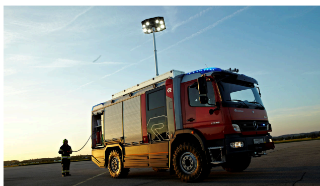
FLEXILIGHT LED im AT